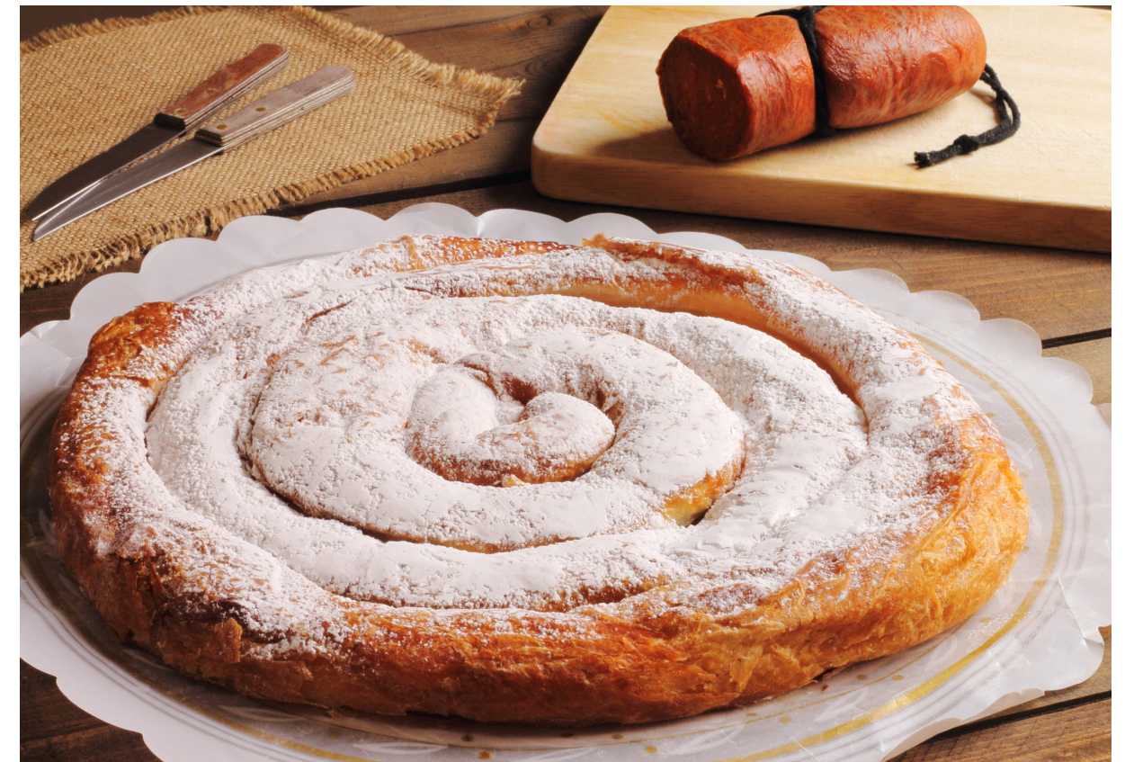
Ensaimada und sobrasada mallorquina

„Trepó“ ist ein weiteres klassisches Gemüsegericht, das jedoch kalt gegessen wird. Auberginen, ein wiederkehrender Bestandteil der mallorquinischen Küche, werden ebenfalls häufig gegessen - mit Fleisch oder Fisch gefüllt und im Ofen geröstet.