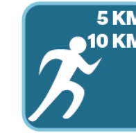
LAUF USSE RHAL DES STADIONS