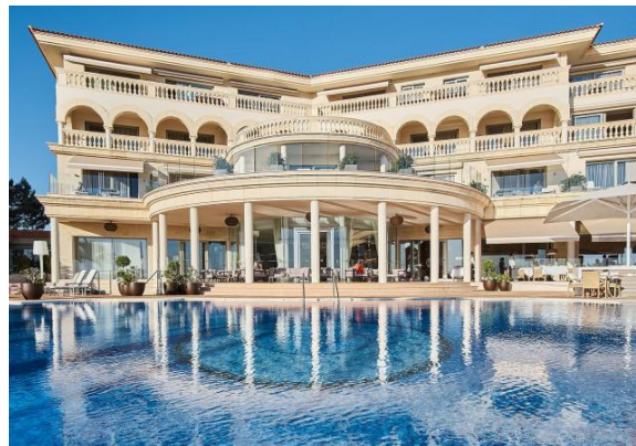
Port Adriano Hotel