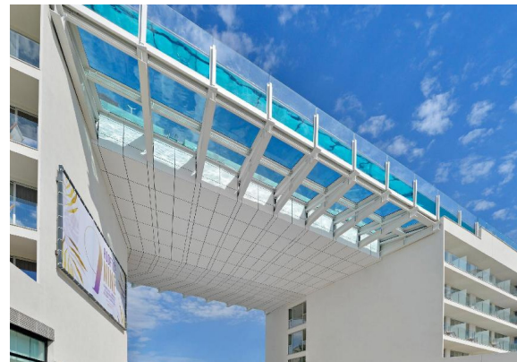
Calvia Beach Hotel