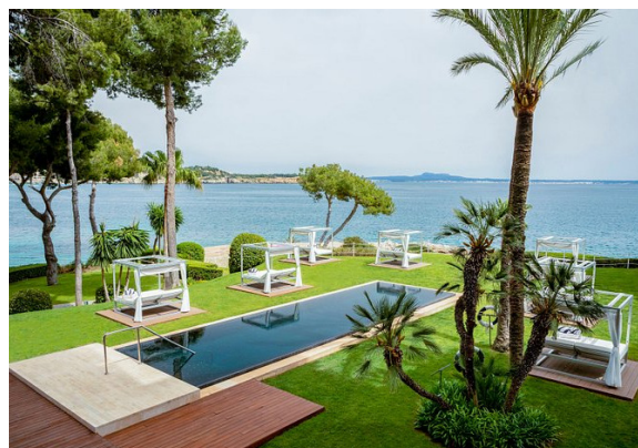
Gran Melià de Mar