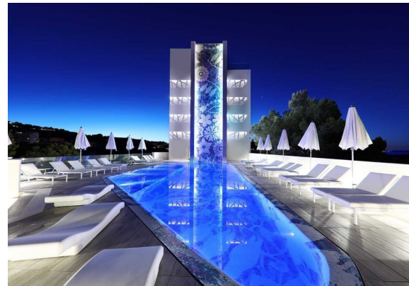
Grand Portals Hotel